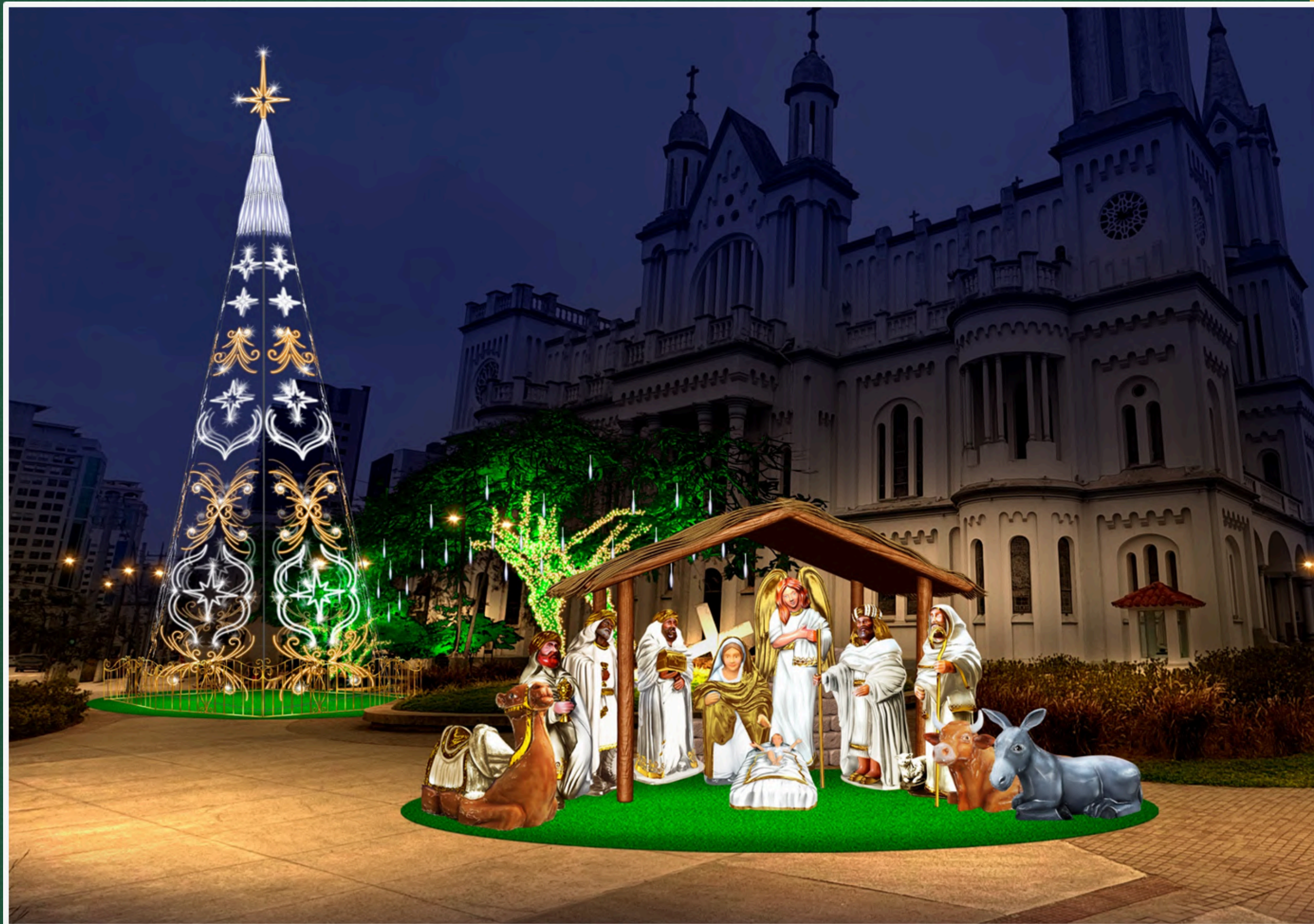
Igreja Matriz - Cenários de Natal